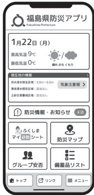
*アプリの画面イメージ

県では、様々な災害情報や防災情報を簡単に入手できるように防災アプリの制作、ポータルサイトを公開しました。これらを上手に活用して、日頃から災害に備え、災害発生時には、迅速な避難行動に繋がしましょう。