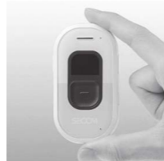
▲ GPS 端末機

認知症等により行方不明になる不安を感じている方へ「GPS 端末機 (居場所を知らせる装置)」を貸与し、対象の方に携帯してもらうことで、万が一行方不明になった時、オペレーションセンターやパソコンなどでおおよその位置を確認し、早期発見につなげることができます。