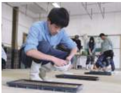
良質な種もみを選別する塩水選の様子 苗箱に丁寧に種をまいていく生徒