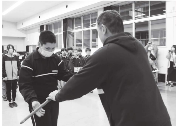
高原本部長から団旗を受ける団員