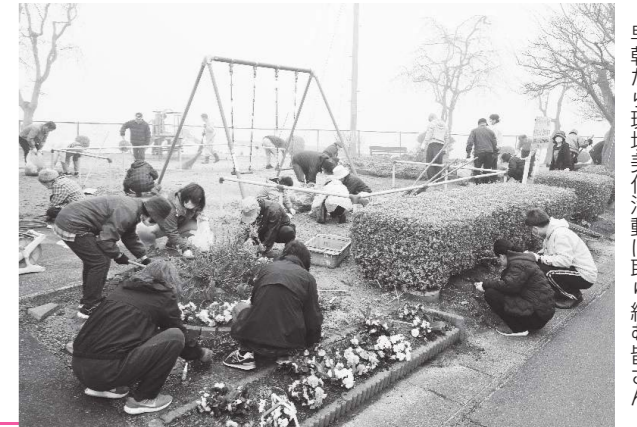
早朝から環境美化活動に取り組む皆さん

4月7日(日)、町内一斉環境美化活動が各地区で行われ、早朝から多くの町民が汗を流しました。 この活動は、美しいまちづくりの一環として、町民みずからの手で町をきれいにすることを目的に、毎年4、6、8、10月の第1日曜日に自宅周辺や歩道、公園などの除草、捨てられたごみ拾いなどの清掃活動を実施しています。 みんなで暮らしやすい快適な生活環境を作りましょう。