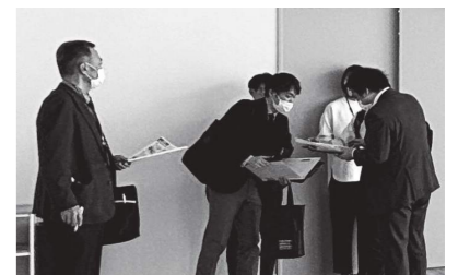
測定会場を視察する福島県立医科大学の先生方